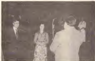
Durante su bishita di orientacion na Aruba, Ministro - Presidente di Hulanda, Sr. A. van Agt y señora tabata huesped di Gobierno Insular na un recepcion ariba 6 di Januari.